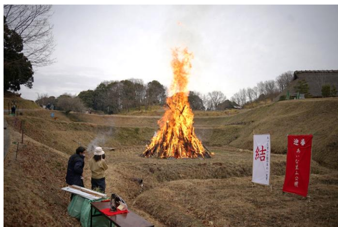
とんど祭り（無観客開催） (令和3年1月11日)