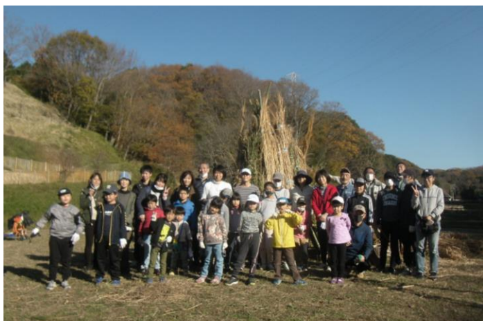
茅刈りイベント・ティピ作り (令和2年12月6日)