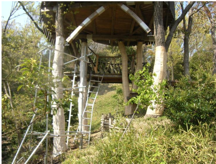
カシノナガキクイムシ対策 (粘着シート被覆状況)