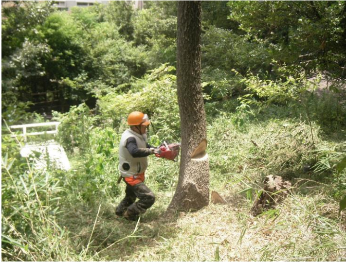
林相整備 (伐倒状況)