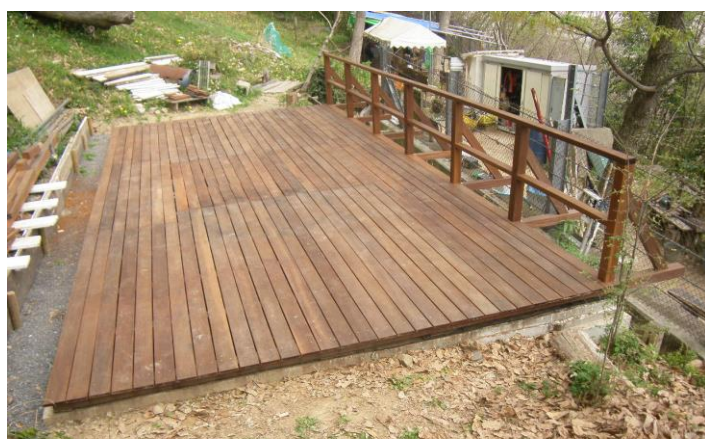
ふれあいの森野外教室 ウッドデッキ完成