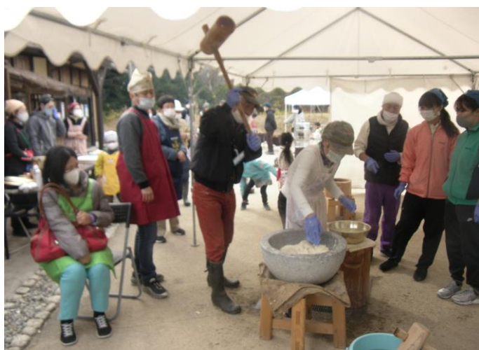
餅つき体験イベント (令和2年12月13日)