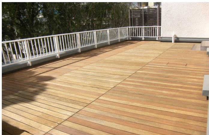
大学校舎ベランダのウッドデッキ完成