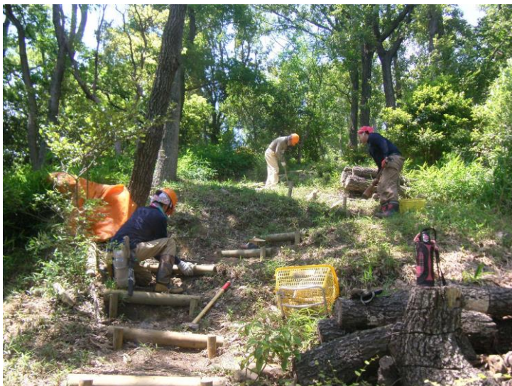
園路階段整備状況