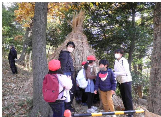
本山第三小学校環境学習 (ツリーハウス広場テピ) 令和4年12月