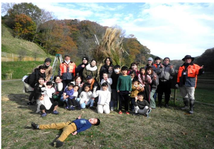
茅刈り体験イベント (刈り取ったススキでテピ完成) 令和4年12月4日