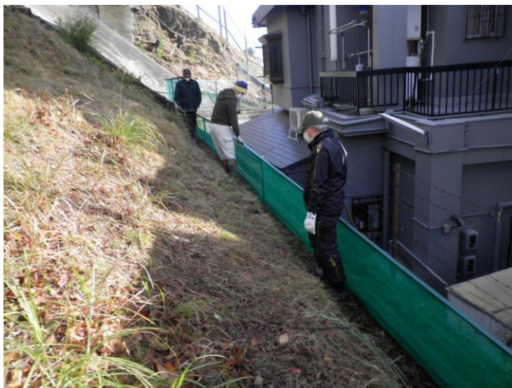
ネット張替え完了立会 (女子大管財課) 令和4年12月