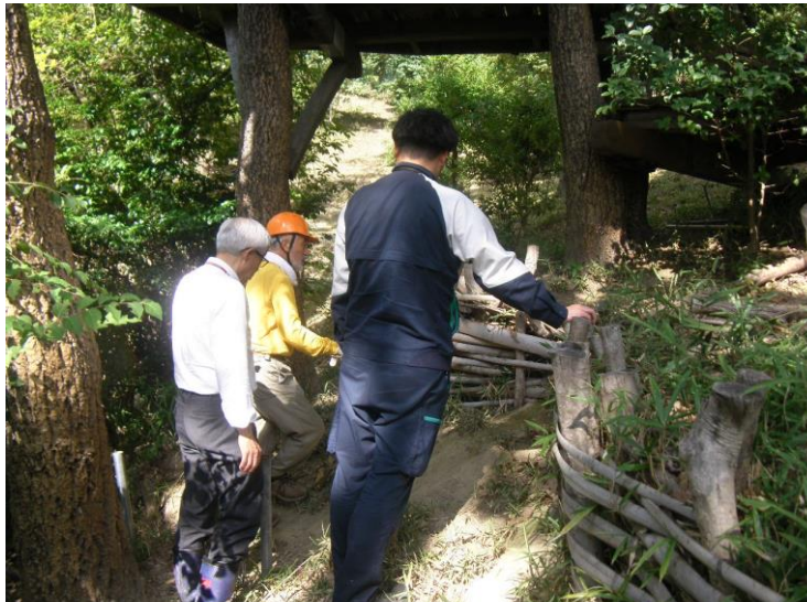
ツリーハウス大学合同点検 (ホストツリー根張り状況) 令和4年10月