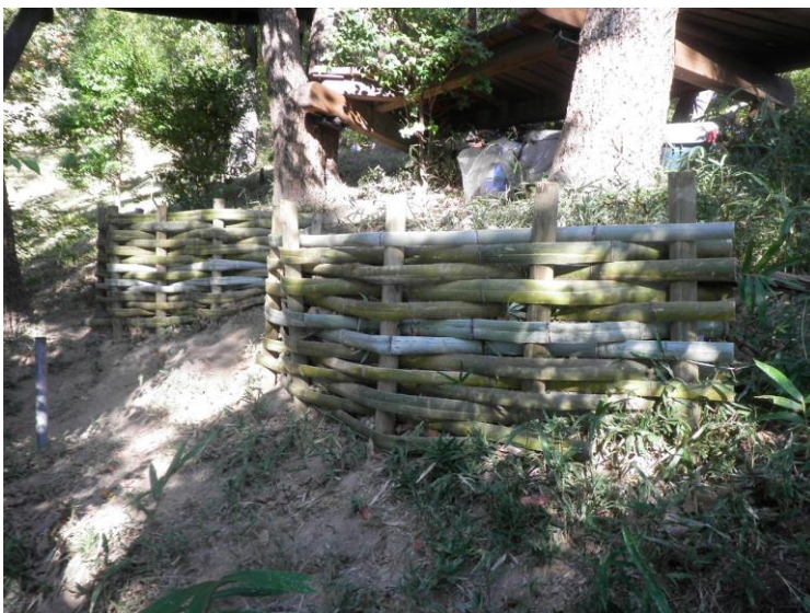
ツリーハウス補修 (ホストツリー根鉢やり替え) 令和4年11月