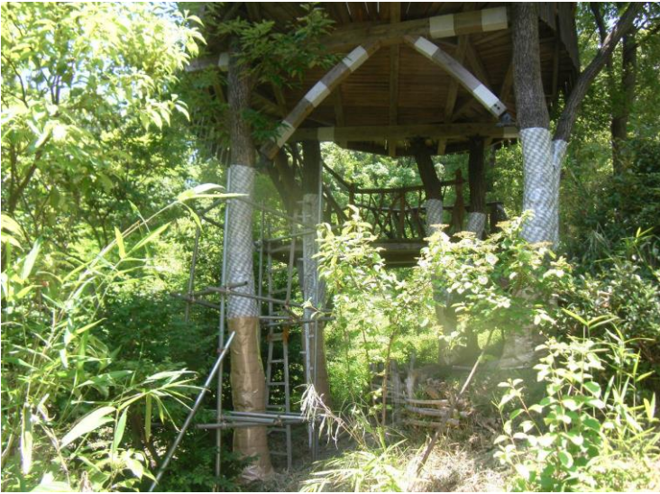
カシノナガキクイムシ対策 粘着シート巻き立て 令和4年6月