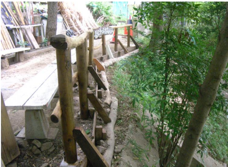
転落防止柵やり替え 令和4年7月