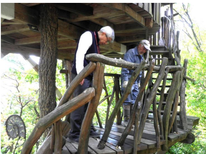
ツリーハウス補修完了立会 (女子大管財課) 令和4年11月