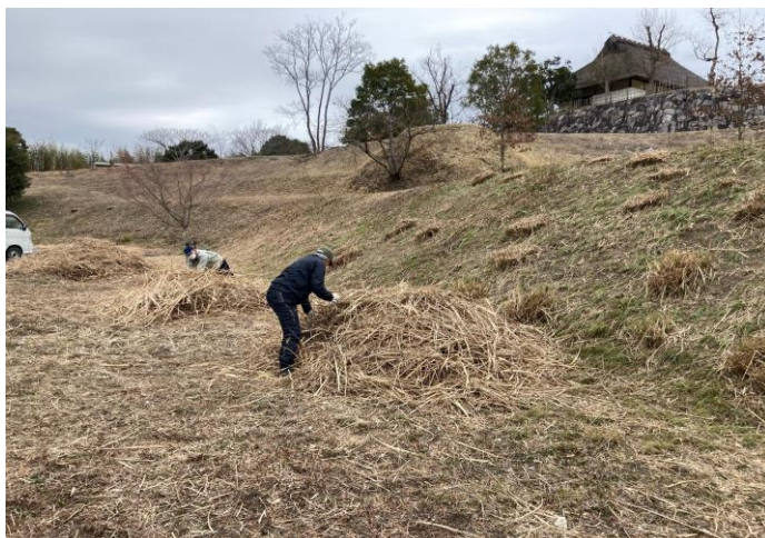
ススキ原の整備状況 令和5年2月18日