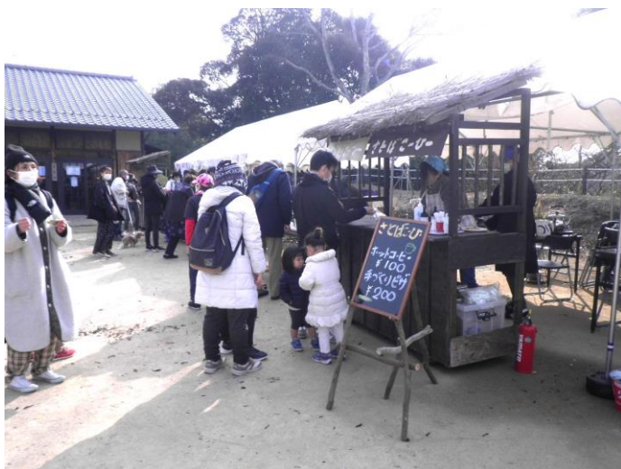
冬フェスタとんど焼きイベント (さとぼこーひー) 出店 令和5年1月9日