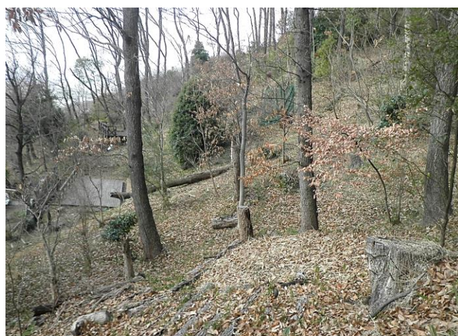
ウッドデッキ周り整備 令和5年2月